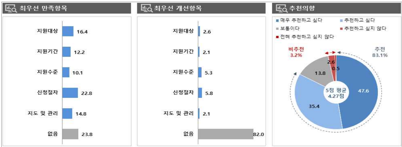
[그림 1] 장애인고용장려금 만족/개선 항목 및 추천 의향

주: 1) 만족항목 - 전체: 지원대상(28.8) > 지도수준(16.9) > 지도/관리(10.3) > 지원기간(9.8) > 신청절차(9.1) ; 없음(25.1) - 창출: 지원대상(23.4) > 지원수준(13.8) > 지도/관리(10.4) > 지원기간(10.1) > 신청절차(9.7) ; 없음(32.6) 2) 개선항목 - 전체: 신청절차(8.6) > 지원기간(5.9) > 지원수준(4.8) > 지원대상(3.7) > 지도/관리(3.1) ; 없음(74.0) - 창출: 신청절차(11.5) > 지원기간(5.0) > 지원수준(4.9) > 지원대상(4.4) > 지도/관리(2.4) ; 없음(71.7) 3) 추천 의향 - 전체: 4.29점, 추천(81.9=31.4+50.5) > 보통(15.4) > 비추천(2.7=2.1+0.6) - 창출: 4.22점, 추천(80.1=33.9+46.2) > 보통(16.8) > 비추천(3.1=2.2+0.9)